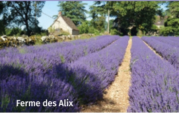
Ferme des Alix