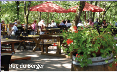
Roc du Berger