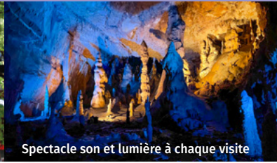
Spectacle son et lumière à chaque visite